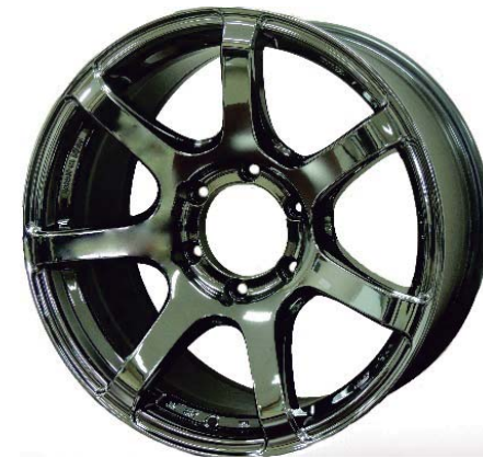
ライトスピードブラックスパッタ

ハイエース・4WDで好調な動きを見せているバックナイン ライトスピードに、新色ブラックスパッタが追加されました。